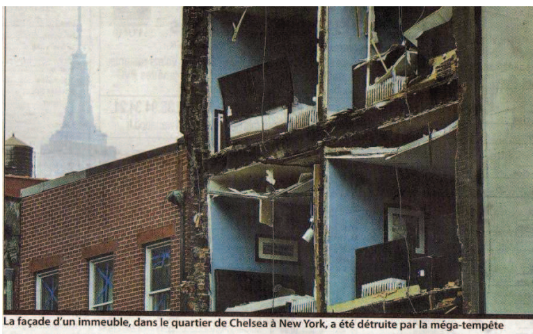
La façade d'un immeuble, dans le quartier de Chelsea à New York, a été détruite par la méga-tempête

OURAGAN. A New York, au moins dix personnes ont été tuées et des centaines de milliers de personnes se sont réveillées hier les pieds dans l'eau ou sans électricité.