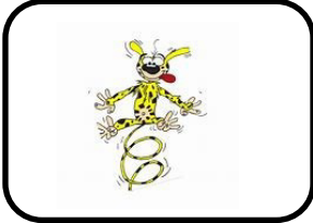
1 - Le marsupilani vit dans la forêt.

Sous chaque photo, indique le personnage, (le sujet), l'action ( le verbe ) et le complément.