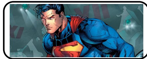
4 - Superman vole dans le ciel.