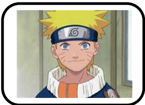
5 - Naruto est un Ninja reconnu.