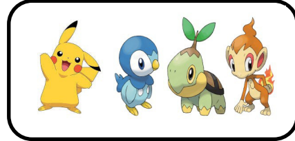
2 - Les Pokémon vivent avec les humains.