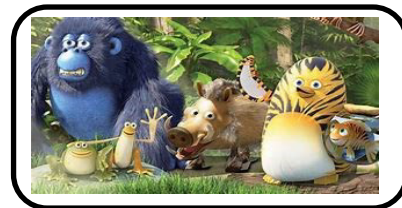
6 - Les as de la Jungle réparent les injustices.