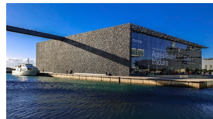
Le Musée des Civilisations de l'Europe et de la Méditerranée