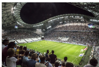
Stade Orange Vélodrome