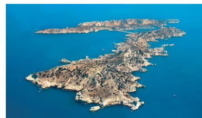
Les Iles de Frioul