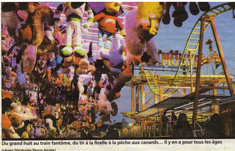
Du grand huit au train fantôme, du tir à la ficelle à la pêche aux canards... il y en a pour tous les âges

QUAIS. Jusqu'au 18 novembre, la foire St Romain s'étale du pont Corneille au hangar 105. Environ 200 attractions attendent les amateurs de sensations fortes